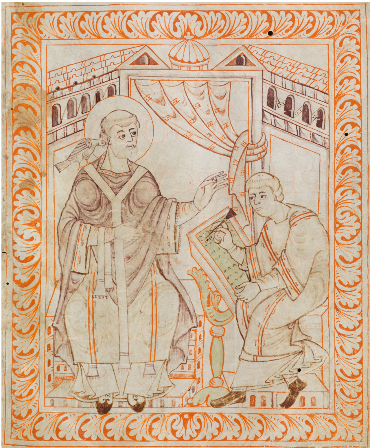
Gregor I. beim Diktieren des gregorianischen Gesangs (aus dem Antiphonar des Hartker von St. Gallen, St. Gallen, Stiftsbibliothek, Cod. 390, p. 13, um 1000)